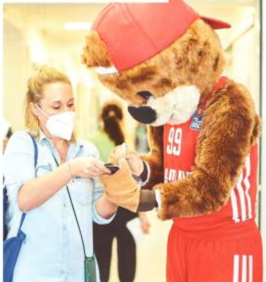
Auch Ben, das Maskottchen des FC Bayern München, unterstützte in der München Klinik Schwabing.