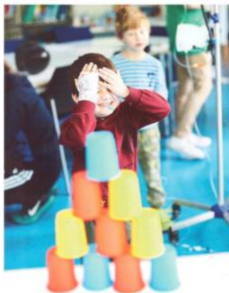
Vor allem Spiel und Spaß stehen am Tag des Lachens für die Kinder im Vordergrund.

Durch persönliche Ansprache erleben die kleinen Patienten, dass sie nicht allein sind, sie dürfen einfach mal wieder lachen und Spaß haben. Auch die Angehörigen waren dankbar für den Besuch. Denn die Künstler waren schon morgens im Wartebereich der Klinik unterwegs und verkürzten den Kindern und deren Eltern dort die Wartezeit. „Ihr solltet öfter kommen, es ist richtig gut, was ihr macht“,