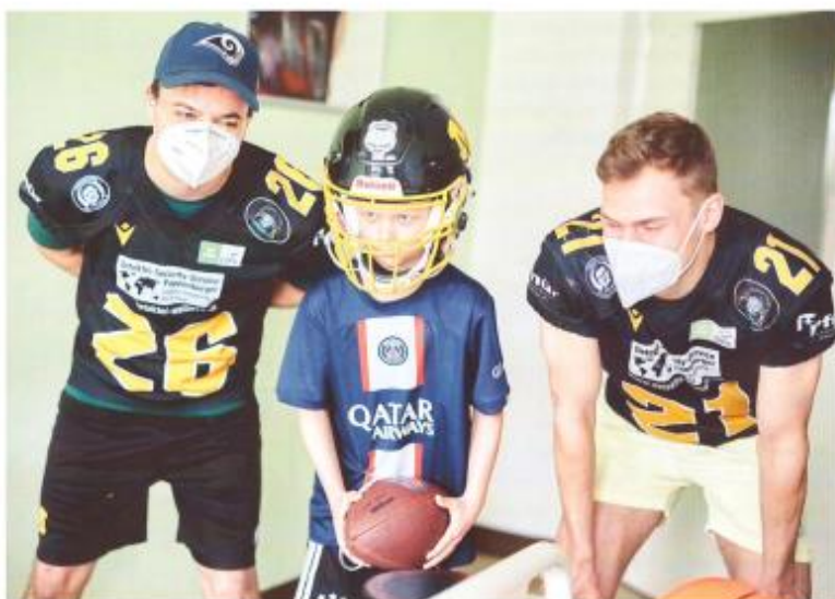
Spieler der Munich Cowboys in voller Montur: Mit ihrem sportlichen Auftritt möchten sie den Kindern Mut und Stärke schenken.